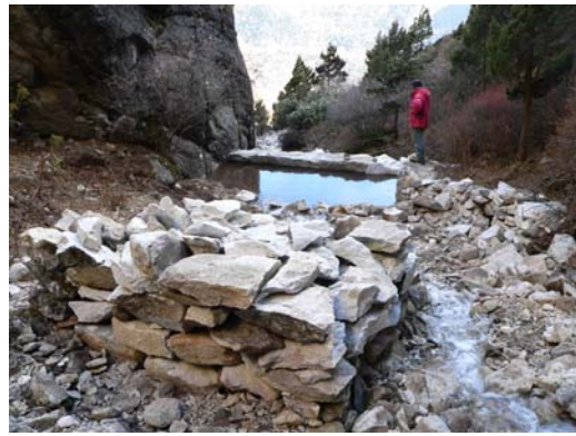
e piena d'acqua

Dalla diga, con 220 m di un grosso tubo da 1 pollice e mezzo, abbiamo portato l'acqua ad un serbatoio di una decina di metri cubi dove poi tutto il villaggio potrà allacciarsi.