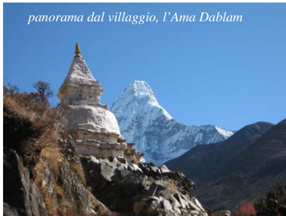
panorama dal villaggio, l’Ama Dablam

Tra i progetti che abbiamo sostenuto con il “Riso Solidale” c’è stato quello di portare acqua a Pangboche in Nepal e ora i volontari, che lo hanno realizzato, ci inviano notizie e foto di quanto fatto.