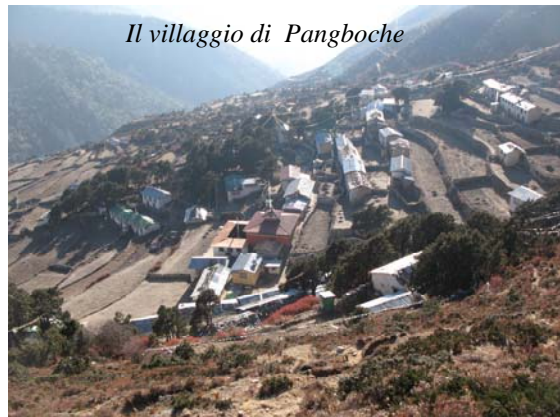
Il villaggio di Pangboche