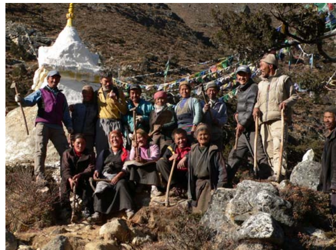
foto ricordo dei lavoratori