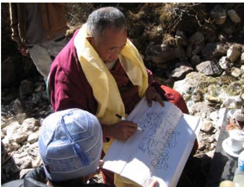
preghiera per l'acqua

L'idea delle fontane ci è subito piaciuta: nella fontana abbiamo costruito una parte riservata al lavaggio e un'altra dove la gente prenderà l'acqua per usi domestici. Nei momenti di siccità, soprattutto in primavera o in caso di scarsità d'acqua, saranno queste ad avere la priorità sugli altri utilizzi.